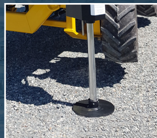
Stabilisateurs hydrauliques indépendants